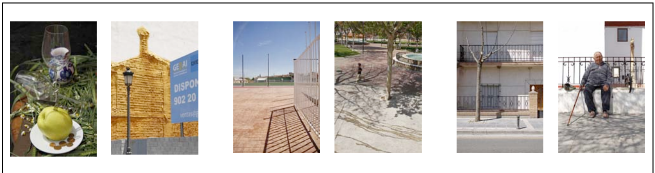
Figura 2: Carolin Bohner (marzo, 2013) Ogijares, Primavera 2012_Serie 5 . Fotografía digital.

La exposición de fotografía que se celebró en el pueblo de Ogijares el pasado mes de noviembre, puede visitarse en la cuenta de flickr que aquí indicamos: