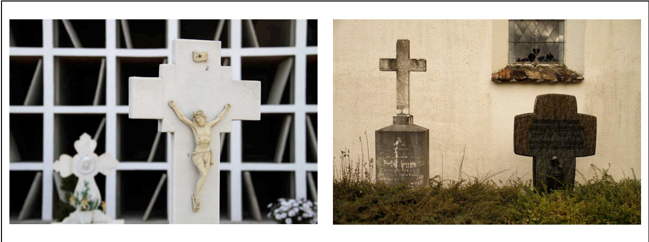
Figura 12: Carolin Bohner (marzo, 2012 - diciembre, 2013) Cruces en el cementerio (Ogijares, España - Bohlingen, Alemania). Fotografía digital.