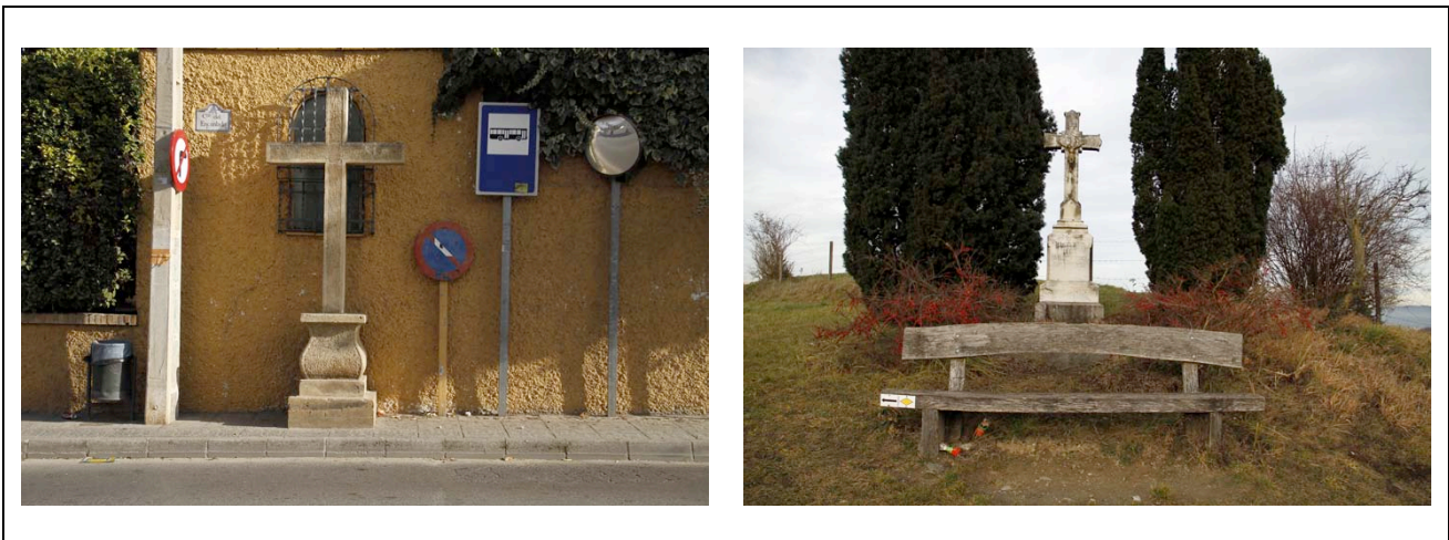
Figura 13: Carolin Bohner (marzo, 2012 - diciembre, 2013) Cruces (Ogijares, España - Bohlingen, Alemania). Fotografía digital.