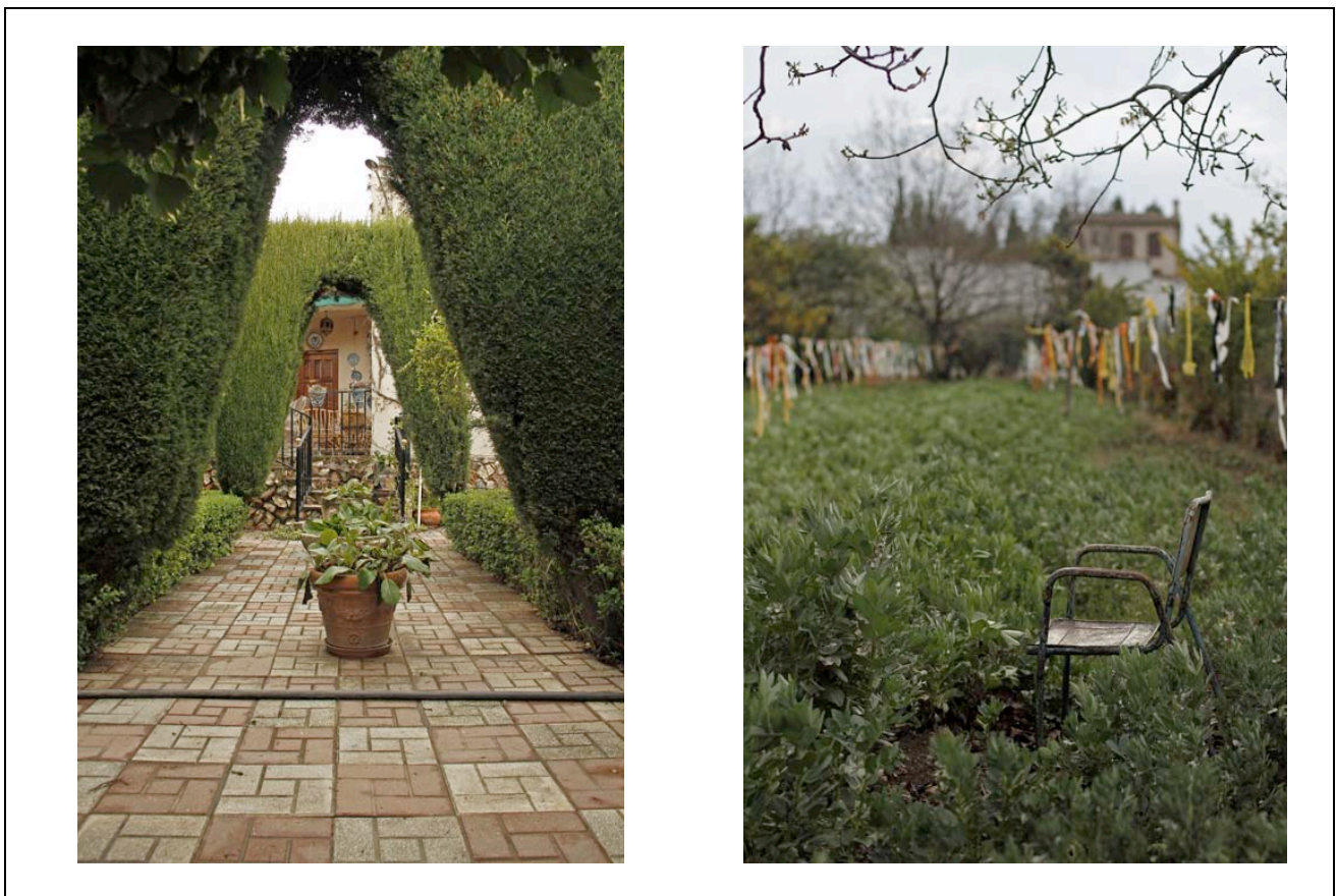
Figura 3: Carolin Bohner (marzo, 2012) Ogíjares, Primavera 2012_ Serie 4, N.º 3 y 4. Fotografía digital.

Un participante que fue invitado a ser entrevistado, sin embargo, ha optado por brindar su visión mediante un poema escrito al efecto, basándose en un determinado par de fotografías (Figura 3), el cual, según su autor, era el que más había captado su atención.