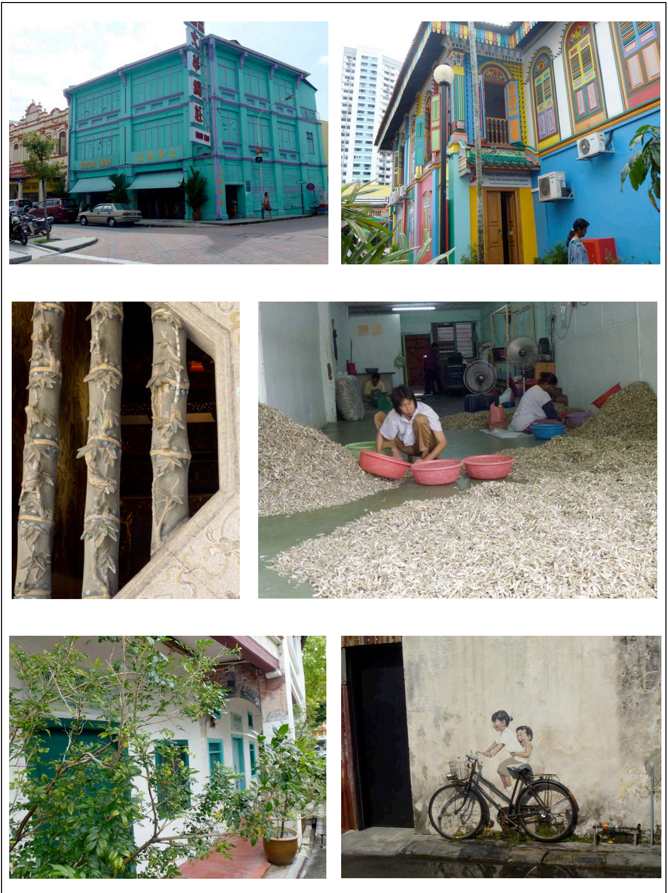
Figura 6: Raquel Ramos Josa (diciembre, 2012) Color y calor . Fotografía digital.

Las imágenes de ambas series constan de tres pares de fotografías y se corresponden tanto en la manera de parearlas como de secuenciarlas, es decir, pueden compararse en función de su disposición.