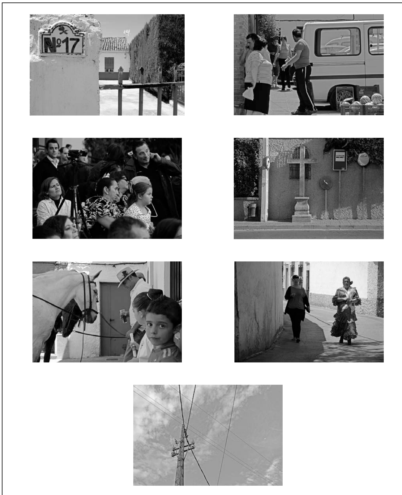
Figura 7: Carolin Bohner (marzo, 2012) Ogijares, Primavera 2012_Serie 1 . Fotografía digital.

El tercer y último ejemplo de ‘fotografía participativa’ constituye, más que un discurso propio, una aportación de datos visuales. El participante en cuestión nos ha proporcionado una serie de tres fotografías (Figura 8, 9, 10 y 11) para completar el contenido de una serie propuesta en el marco de la exposición (Figura 7). Según él, dicha serie pretende dar una visión global de la vida del pueblo, pero a la que le faltan unos aspectos relevantes sin los cuales no podría concebirse.