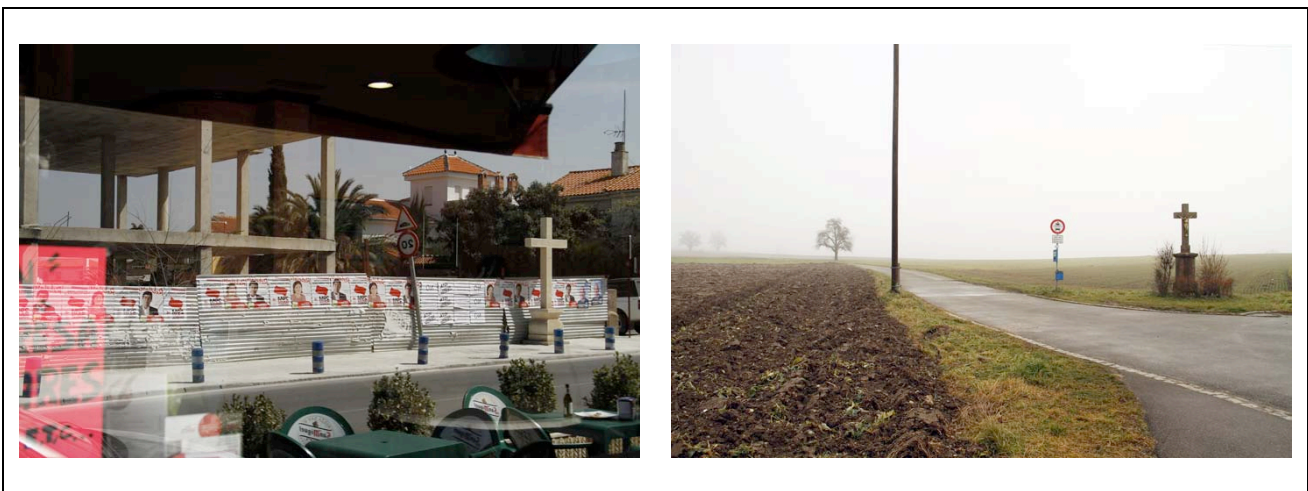
Figura 14: Carolin Bohner (marzo, 2012 - diciembre, 2013) Cruces (Ogijares, España - Bohlingen, Alemania). Fotografía digital.