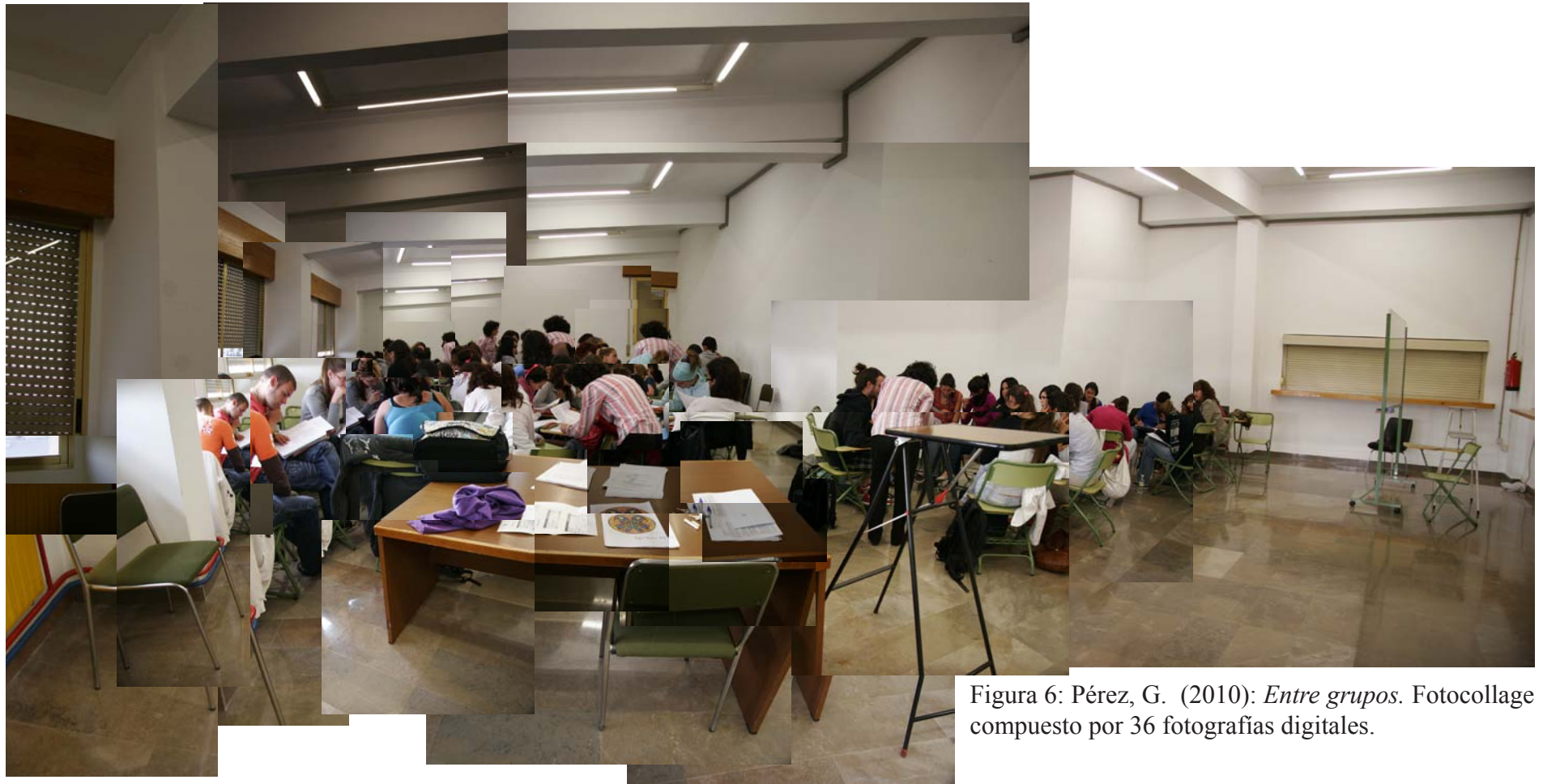
Figura 6: Pérez, G. (2010): Entre grupos . Fotocollage compuesto por 36 fotografías digitales.

mínimos acedemos progresivamente hacia el contenido general expuesto en la imagen. Esta estrategia visual nos permite atender tanto a elementos periféricos como a aquellos más determinantes para la argumentación visual de las ideas. A través del ensamblaje de las imágenes de las acciones, el contexto humano y material o las relaciones interpersonales, es como se da forma al contenido en un fotocollage de estas características. Por tanto, estas composiciones plantean reflexiones alrededor el sujeto investigado, pero al mismo tiempo también revelan la mirada del investigador.