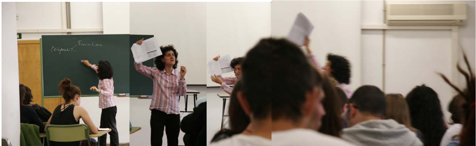
Figura 4: Pérez, G. (2010) Fotocollage borrador cuarta sesión con Puri, 2. Fotocollage compuesto por 4 fotografías.