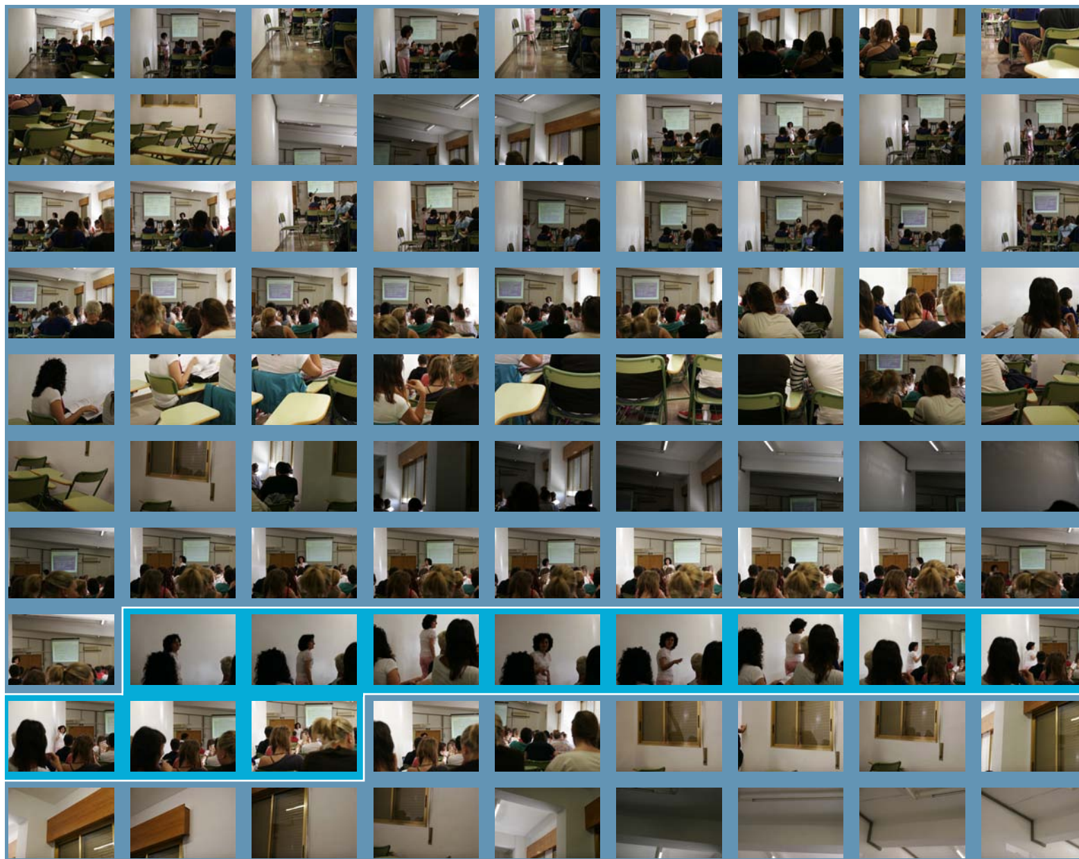
Figura 1, en esta página y en las tres páginas sucesivas: Pérez, G. (2014) Tercera sesión con Puri, analizada por colores. Tabla visual compuesta por 311 fotografías.