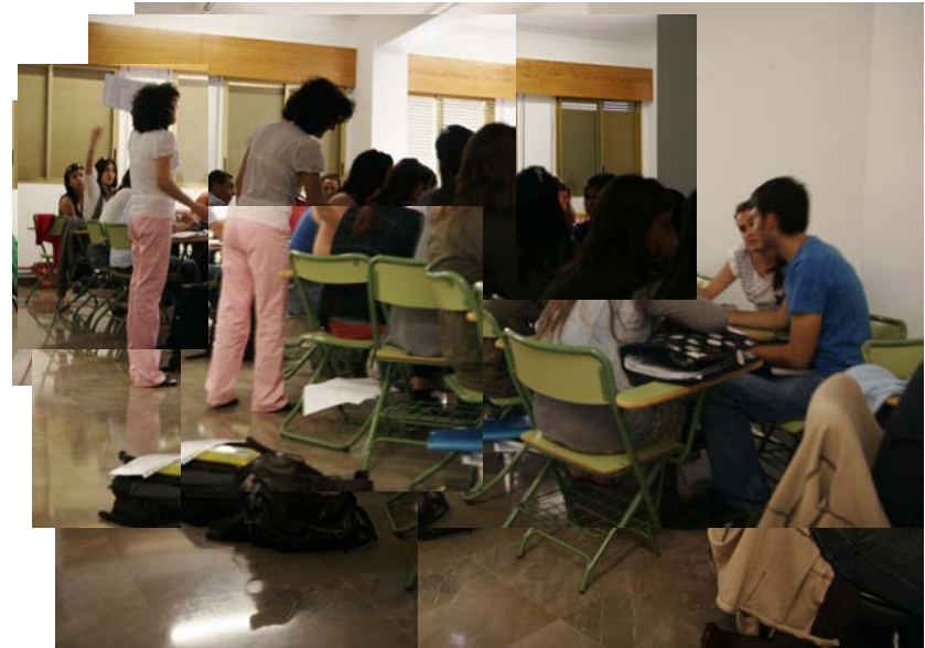
Figura 3: Pérez, G. (2010) Fotocollage borrador tercera sesión con Puri. Fotocollage compuesto por 9 fotografías.