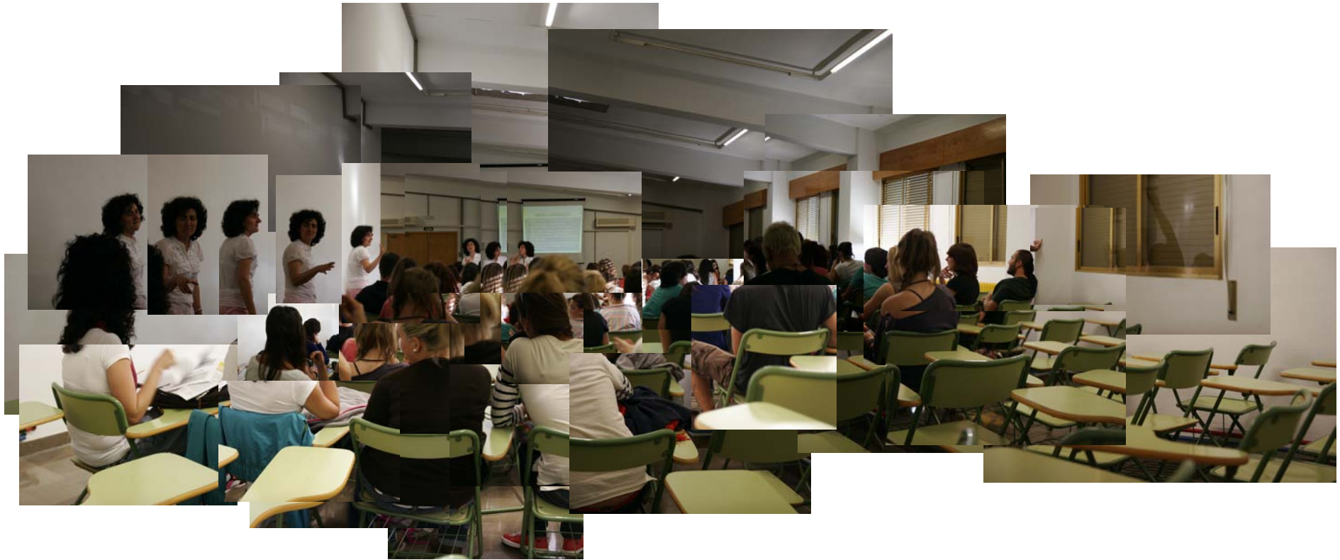
Figura 5: Pérez, G. (2010) A lo largo del aula. Fotocollage compuesto por 36 fotografías.