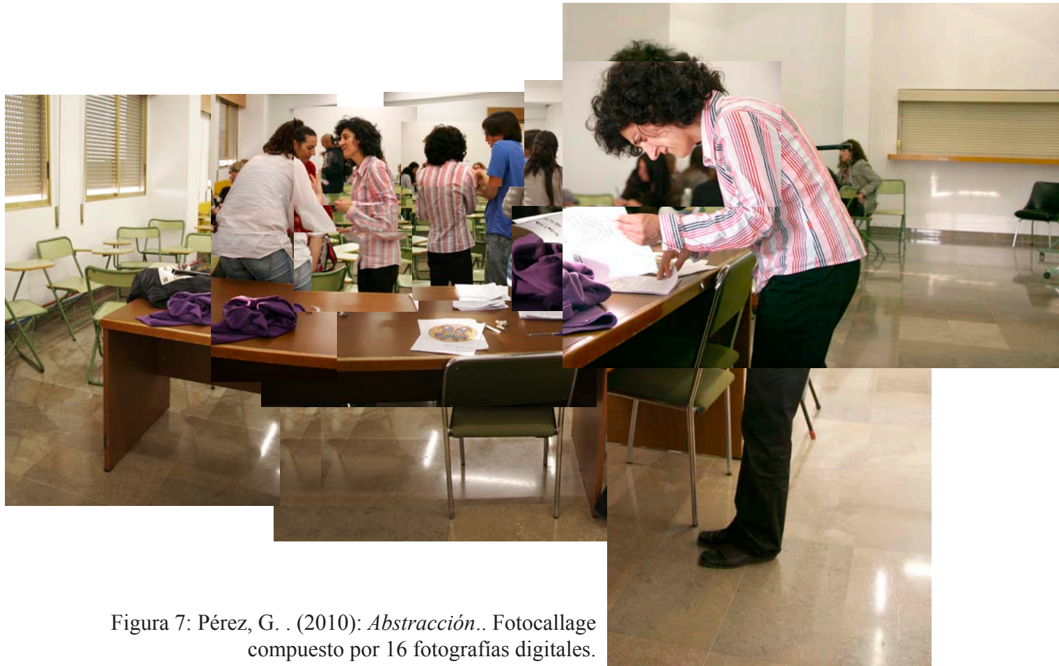
Figura 7: Pérez, G. . (2010): Abstracción.. Fotocallage compuesto por 16 fotografías digitales.

del contexto y muestran simultáneamente aspectos significativos del docente, de su alumnado, de su contexto, de sus relaciones, sus actitudes, su manera de trabajar, etc., por ejemplo vinculando diferentes sesiones en las que entre otras cualidades y aspectos se destacan las diferentes dimensiones del docente.